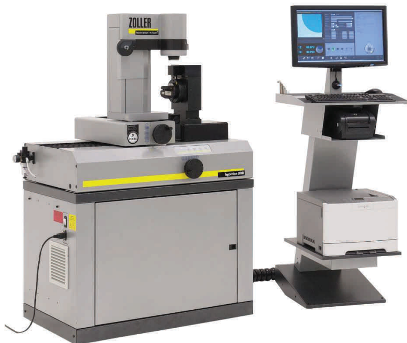
»hyperion 300« s upínací deskou a základním upínačem »GA-PP«.