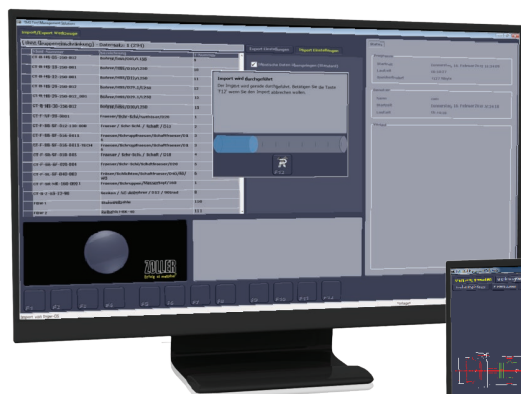
Import export dat v XML formátu – nezávislé na platformě dat