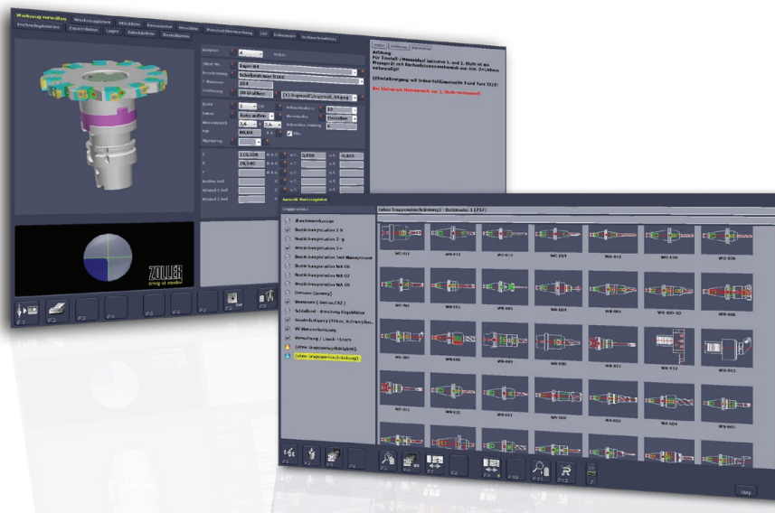
Přehledná správa dat nástrojů se systémem ZOLLER TMS Tool Management Solutions

Přehled výrobního procesu: BRONZE paket obsahuje následující kroky: příprava práce, CAM -> konstrukce, CAD -> sestavení/rozložení nástrojů -> kontrola, seřizování, měření -> výroba