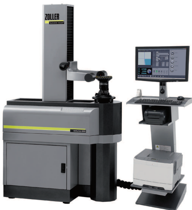
Měřicí a seřizovací přístroj ZOLLER »venturion 600« s multifunkční ovládací jednotkou »cockpit«