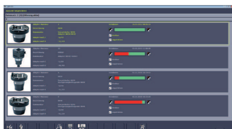
Správa nulových bodů