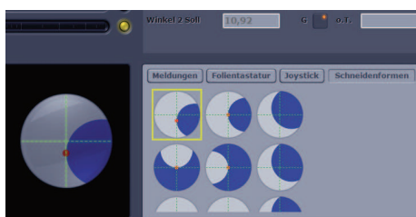
Automatické rozeznání tvaru břitu